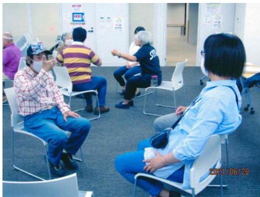
【手話言語条例について学ぶ】