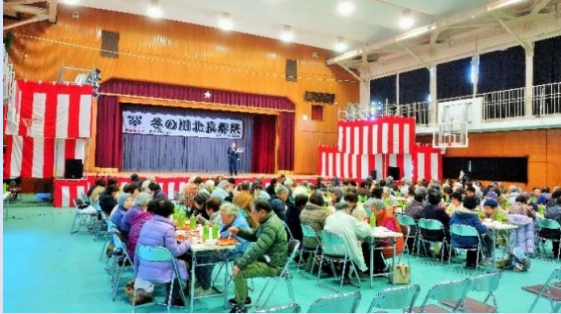
長寿祭（ふれあい昼食会）