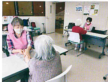
ハンドマッサージボランティアの様子

赤ちゃんから高齢者まで、アロマやハーブを心身の健康に活かす ための勉強会やハンドマッサージボランティアを通して、地域の 方々と心のつながりを持ちたいと思 い活動しています。