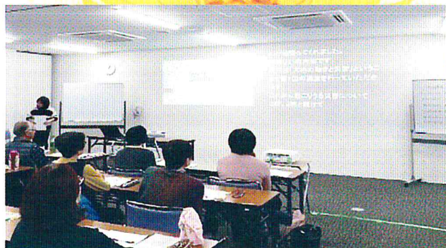
川西難聴者 耳の会と「防災を学ぶ」

聞こえの不自由な方に筆談などの方法で、交流をしながら社会参加をサポートしています。 1984年に要約筆記を主な活動として結成しました。 川西難聴者 耳の会との交流、聞こえを学ぶ筆談ボランティア講座の実施が主な活動です。 また(公財)車両競技公益資金記念財団の助成金で、ノートパソコンを購入し、交流会を実施しました。 今年度からは、要約筆記をすることで中途失聴・難聴者の社会参加を支援できることを啓発していく予定です。