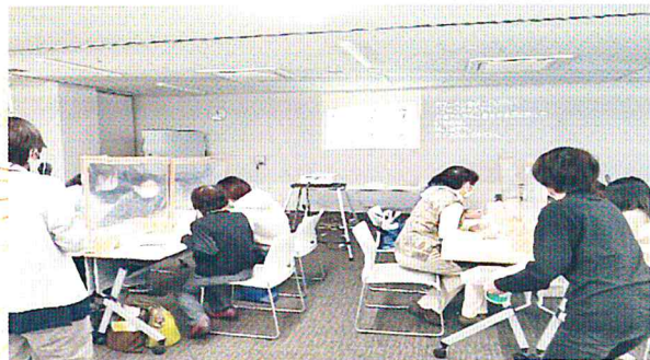
聞こえを学ぶ筆談ボランティア講座