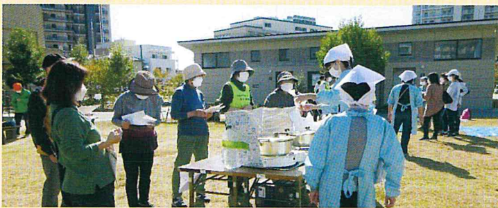
災害時のパッキング

キセラせせらぎ公園で、“災害食クッキング”と一緒に公園の災害時用設備（かまどベンチ・マンホールトイレ）の使用方法について学びました。公園に遊びに来ていた方も何名か参加してくださり、災害時用設備について広く知って頂く機会となりました。