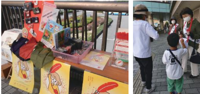
〈↑10月1日川西能勢口駅周辺にて赤い羽根共同募金街頭募金の様子〉