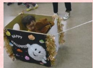
◀公民館で開催された「ベイビハロウィン」の様子