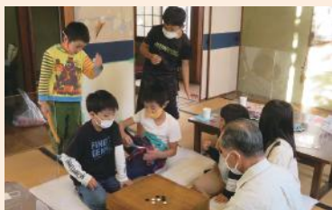
桜小地区福祉委員会 カフェはなやま

身近な地域で、カフェやサロン、お祭りなどのイベントに参加して、ご近所でのつながりをつくることも、困ったときに、支え合うことができる関係づくりにつながります。