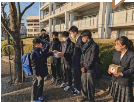
〈↑川西中学校の生徒会による赤い羽根共同募金街頭募金の様子〉