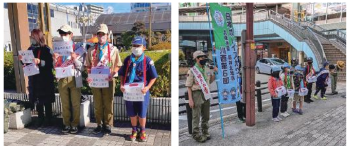
〈川西能勢口駅周辺にて歳末たすけあい運動街頭募金の様子〉 〈↓ボーイスカウト川西第1団〉 〈↓ボーイスカウト川西第6団〉

12月の早朝、一週間にわたって手作りの募金箱を使って街頭募金を行っていただきました。