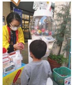
〈↑トナリエ清和台「青空コンサート」での募金〉