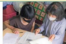
通帳の残高と一緒に確認し、出金額の相談をしています