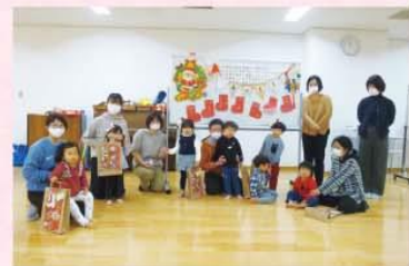
【クリスマス会の様子】