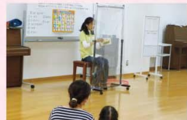
【感染対策をした活動の様子】