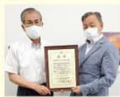
地域支援グループ 「ひまわり」 様

善意銀行へ多額のご寄付や長年に渡りご寄付くだ された企業様や団体様へ感謝状の贈呈に伺いました。 あたたかいご支援ありがとうございます！