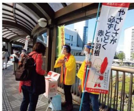
令和2年度街頭募金の様子