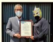
NPO法人 プロレスリングアンサー 様

善意銀行へ多額のご寄付や長年に渡りご寄付くだ された企業様や団体様へ感謝状の贈呈に伺いました。 あたたかいご支援ありがとうございます！