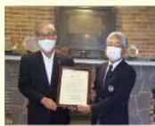
一般社団法人 鳴尾ゴルフ倶楽部 様