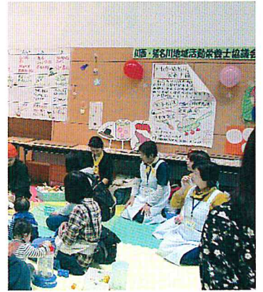
2018年度子育てフェスタにて