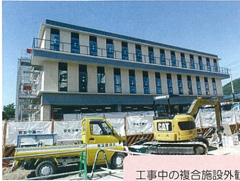
工事中の複合施設外観

平成30年4月入会の2グループを紹介します。 V連行事の協力参加や活躍を期待しています。