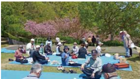
▲世代間交流事業として「地元巡りハイキング」を実施。 花見をしながら食べるお弁当は格別!

高齢化率の低いけやき坂ですが、介護や認知症予防といった高齢者福祉の課題もちらほら出てきています。「認知症の方やその家族等が気軽に立ち寄り、お茶を飲んでくつろいだり、おしゃべりしたり、相談することができる『居場所』がこの地域にもあったら」との思いから、“認知症カフェ”を12月に立ち上げました。地域住民のみなさんにはまだまだ知られていませんが、みんなの拠り所となるよう準備を進めています。