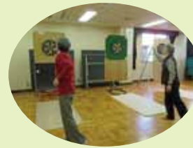
▲趣味の会(卓球・ダーツ)