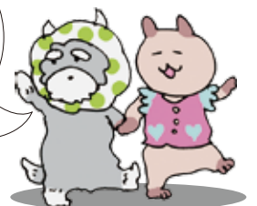
シャーちゃん キョーちゃん

「せいさく」の時間では、クラスごとに、園児が、はさみやのり、クレヨン等を使って、季節の作品作りに取り組んでいます。