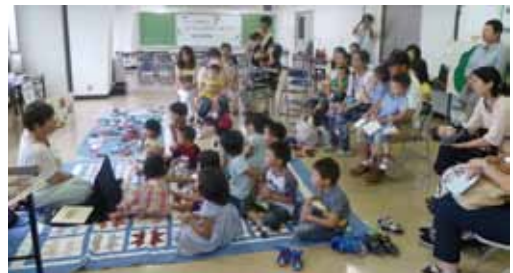
▲今年度の交流会ファミサポ祭の様子

かわにしファミリーサポートセンターは、市の委託を受け、社協にて開所し15年を迎えました。当初は、対象の子どもの年齢は0歳から小学3年生で、母親が仕事を持っている家庭が対象でした。今は、6年生まで対象となり、仕事をしている家庭だけではなく、子育てをしているすべての家庭まで対象は広がりました。隣の猪名川町もこのセンターの管轄になります。年2回行われる交流会では、会員さん同士の交流を図っています。