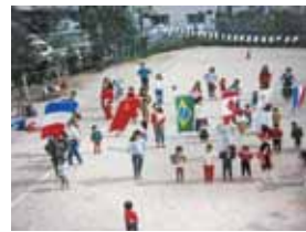
▲開設当初はグラウンドがありました