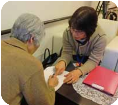
▲生活支援員が、生活費をお届けし、状況を伺います。

認知症や知的障がい、精神障がいなどで判断能力が不十分な方を地域で支える仕組みの一つに、福祉サービス利用援助事業があります。市社会福祉協議会が預金通帳や印鑑を預かり、日常の金銭管理を行っています。