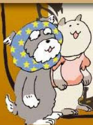
シャーちゃん キョーちゃん

この作品は、小戸作業所を利用されている方々が、春から「ハロウィン」をテーマに制作したものです。