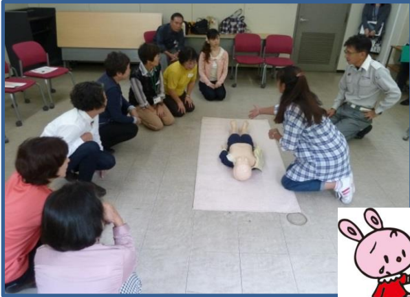
▲猪名川町役場にて