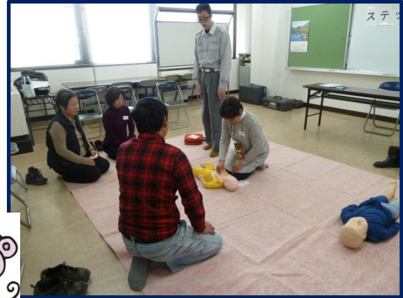
▲川西市ふれあいプラザにて