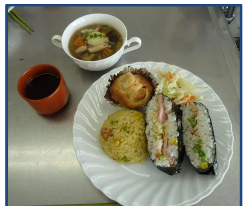
▲美味しそうに出来上がりました！

1月19日、毎年恒例の調理実習の講習会が行われました。今年のメニューは、おにぎらず、カレーピラフ、ニョッキときのこのスープ、バナナカップケーキです。テーマは、「短時間で作れるバランスのとれた簡単な軽食」でした。夕方から夜にかけてのサポート時、預かっているお子さんに提供する軽食、または夕食。パパッと簡単なメニューを何品か知っていれば、次から役に立つはずです！今回は、軽食がテーマでしたが、アレンジ次第で夕食にも対応できると講師の先生からのアドバイスもいただきました！