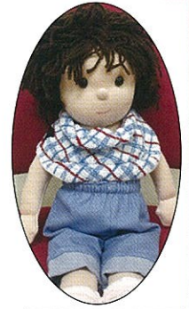
作製依頼の 着せ替え人形

活動の目的は障がい児・者への援助活動と布の絵本・遊具作りです。 会員は16名。ほとんどがシニア世代ですが、活気いっぱいあふれる活動を展開中。 グループの良い点はみんなで考え・話し合って解決することです。 来年は設立40周年を迎えるので何をしようかと相談中です。 毎年、全国の手作り絵本コンクールに出品し、高い評価を受けています。 昨年5月、東京布絵本連絡会主催の「布の絵本展」に作品を出品し見学に行きました。 その時、世田谷区の図書館ボランティアの方から絵本を借りたいと依頼がありました。 その絵本と同じものを2冊作製したとのことで写真と手紙が届きました。 絵本の裏表紙に「原作：川西市 ボランティアいずみ」と刺しゅうしてあり みんな大感激！やったね！