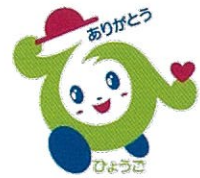
譲りあい感謝マーク