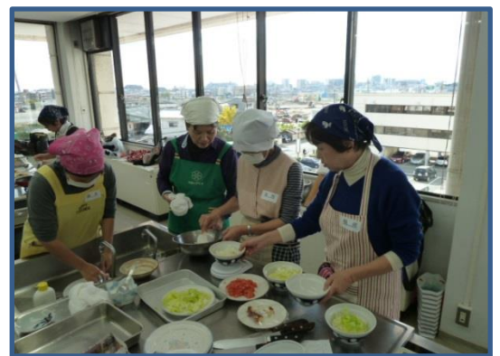
▲中央公民館の調理実習にて

11月7日と19日の2日間に分けて、ボランティア活動センターと地域担当とコラボして、NPO 法人学習生涯サポート兵庫の方を講師に迎え、子育て支援者講座を行いました。人気のある講師の先生をお迎えし、笑いあり、涙ありの講習会となりました。（写真下）