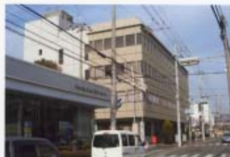
(ふれあいプラザの外観だよ！)