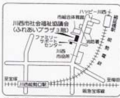
近鉄 電車 扇形橋駅から徒歩5分 阪急・能勢電車 川西船場駅から徒歩10分

申込み・問合せ先：社会福祉法人 川西市社会福祉協議会ボランティア活動センター 〒666-0017 兵庫県川西市火打1丁目-1-7(ふれあいプラザ3階) ☎ 072-759-5200 Fax 072-759-5203 Eメール vc@k-shakyo.or.jp ホームページアドレス http://www.k-shakyo.or.jp/