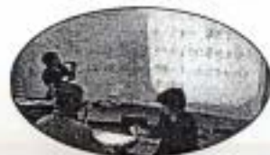
一例:要約筆記ボランティア講座

☆社協会員募集中☆ 会費はボランティア活動費にも充てられます。詳細は社会福祉協議会へ